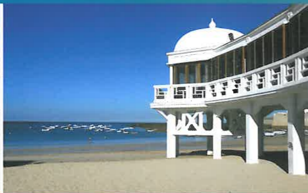
BAHÍA DE CÁDIZ