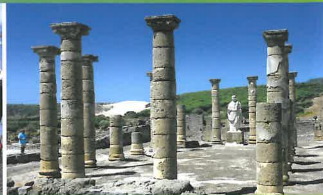
EL CAMPO DE GIBRALTAR

La que fuera la laguna más grande de España da nombre a esta comarca de campo y playa. Comenzamos en Conil de la Frontera , pueblo marinero con playas extensas y gran ambiente turístico. Siguiendo la orilla se llega hasta la playa del Palmar y las playas de los Caños de Meca ya en el término municipal de Barbate .